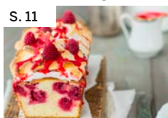
S. 11 Himbeer-Baiser Kuchen