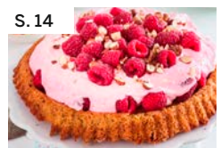
S. 14 Nusskuchen mit Himbeer-Mascarponecreme