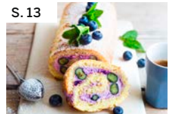
S. 13 Heidelbeer-Biskuitrolle