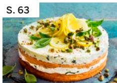
S. 63 Zitronentorte mit Basilikum