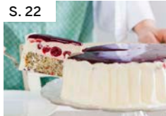
S. 22 Mohntorte mit Amarenakirschen und Rotweingelee