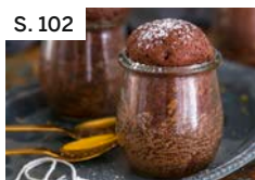
S. 102 Kleine Rotweinkuchen im Glas