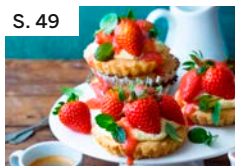
S. 49 Kleine Mandel-Erdbeer-Törtchen