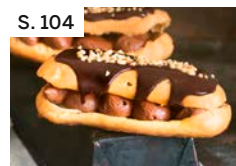
S. 104 Schoko-Eclairs mit Nuss