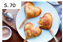
S. 70 Apfel-Zimt-Küchlein am Stiel