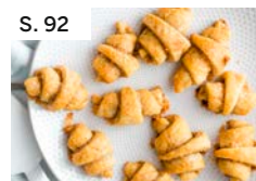
S. 92 Kleine Zimtcroissants mit Walnussfüllung