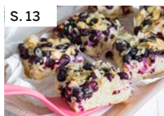
S. 13 Butterkuchen mit frischen Heidelbeeren