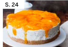
S. 24 Kleine Joghurttorte mit Mandarinen und Mohn