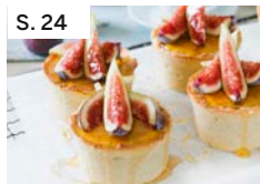
S. 24 Feigen-Limetentörtchen