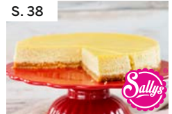
S. 38 New York Cheesecake mit Erdbeersoße