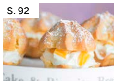
S. 92 Windbeutel mit Mango-Honig-Füllung