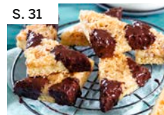
S. 31 Feine Paranuss-Ecken