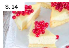
S. 14 Biskuit-Frischkäsecken mit Johannisbeeren