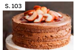
S. 103 Schokotorte mit Rotwein-Äpfeln