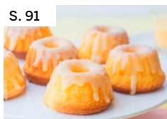
S. 91 Mini-Eierlikör-Gugelhupfe