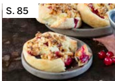
S. 85 Fruchtschnecken mit Marzipanstreuseln