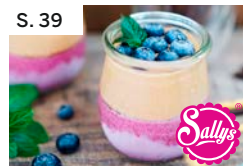
S. 39 Blaubeer-Joghurt-Dessert mit Schokolade