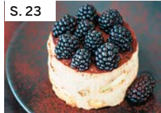
S. 23 Mascarponetörtchen mit Espresso-creme