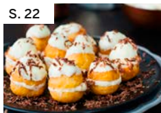
S. 22 Profiteroles mit Espresso-sahne