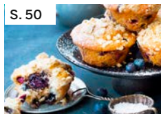
S. 50 Ahornsirup-Heidelbeer-Muffins mit Haferflocken