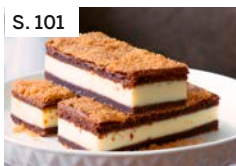
S. 101 Frischkäse-Schokoladen-Riegel