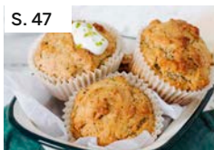
S. 47 Vegane Chiamuffins mit Kokos