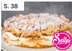
S. 38 Schneemousse-Torte