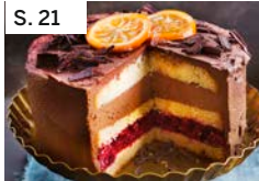
S. 21 Glühweintorte mit Kirschen