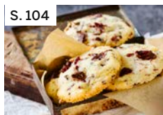
S. 104 Schokoladen-Muskat-Cookies